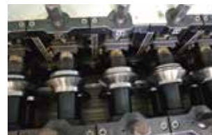
Paslanmaz Roll Forming / Stainless Roll Forming